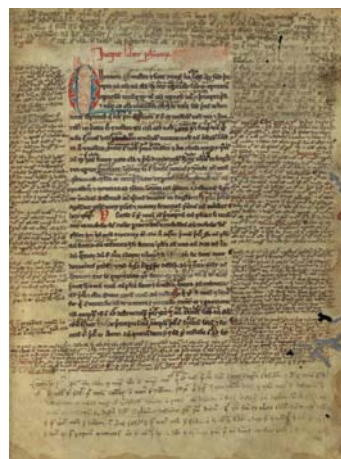
Walters Art Museum MS 66, fol. 1r.

Mert milyen is ezeknek az utalásoknak karaktere, nem csupán a szöveg, hanem az írás és gondolkodás szerepének kontextusában? A szövegek közötti rövid bibliográfiai utalás lezár, visszafelé utal. A lábjegyzet megnyit, a jövőbe visz, egyfajta folyamatot és dialógust tesz lehetővé az olvasóval. Ez számomra a szöveg igazi szerepe. De a lábjegyzet az alkotási folyamat vizuális képe is, a belső dialógust is nyitva tartja és a marginális térbe delegálva a konkrét érvbe nem egészen szervesen beleilleszkedő gondolat további lehetőségek tárházává válik, az író és az olvasó számára egyaránt. A lábjegyzet élővé teszi a szöveget, inspirál, további gondolkodásra indít, az oldalon elfoglalt helyéből adódóan asszociációra ösztönöz, míg a szövegek közötti utalás átjár, kivon egy nem jelenlévő, hiányzó térbe. A végjegyzet, bár nyitva tartja annak lehetőségét, hogy a lábjegyzet tartalmát átvegye, vizuális elérhetetlensége folytán pontosan annak a látás számára azonnal elérhető jellegét veszíti el.