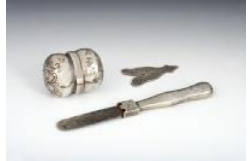
Bécsi mohél készlet, antik ezüst.