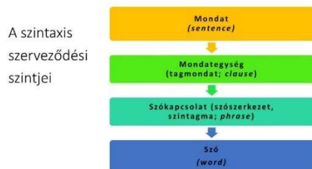
1. ábra: A szintaxis szerveződési szintjei.

A 2. ábra további jelentéstípusokat is bemutat. Így a melléknevek (Adj) és melléknévi csoportok (AdjP) entitások tulajdonságait, a számnevek pedig mennyiségeket fejezhetnek ki. A sor még folytatható lenne tovább, de egyelőre ennyi is elegendő számunka az alapfogalmak megértéséhez.