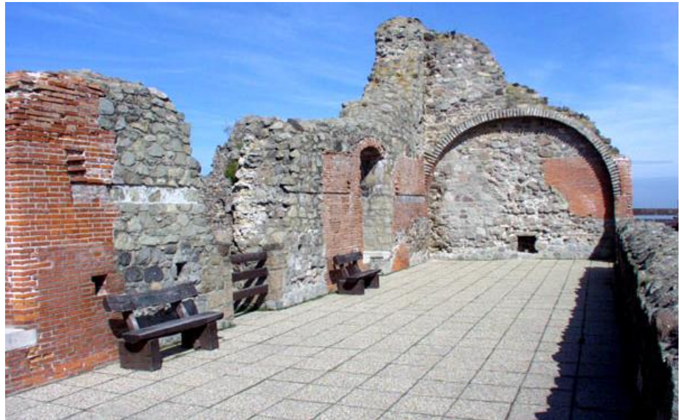
A visegrádi fellegrád lovagterme: középkori kőfal és modern téglák .