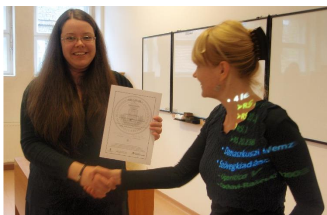
3. ábra: A tréning résztvevői átveszik jól megérdemelt oklevelüket.

A hallgatók visszajelzései a tréning után a kezdeményezés sikeréről tanúskodnak. „Kötelezővé kéne tenni valamennyi szakon,” valamint „remélem, hogy jövőbeli tréningek folyamán is lesznek majd interaktív feladatok, mert nemcsak szórakoztatóak, hanem hihetetlenül hasznosak is voltak, sokat fejlődtem mind szakmailag, mind szellemileg általuk” – írták az anonim online kérdőívet kitöltők.