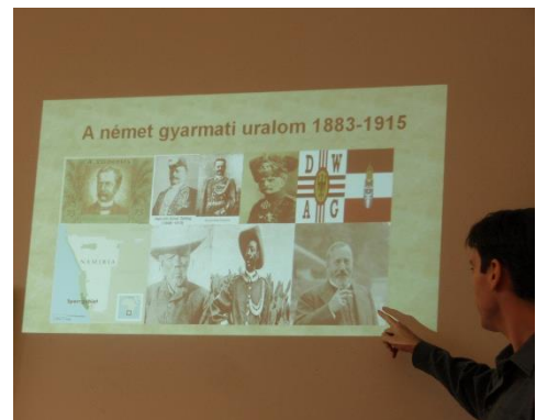
2. ábra: A hallgatók előadásai a tréning utolsó két napján.

Ezt az intenzív szakaszt látszólag egy kis pihenő követte. Azonban a hallgatók ekkor készítették el azokat a prezentációkat, amelyeket a következő héten, május 10-én és 13-án adtak elő társaiknak (2. ábra). Az első két napon elhangzottakat kellett ezáltal saját kutatási témájukra alkalmazni. A tízperces prezentációk nem feltétlenül tartalmaztak új kutatási eredményeket, a hangsúly sokkal inkább a prezentációtechnikán, az operacionalizálható kutatási kérdés megfogalmazásán és a kutatási folyamat alapos megtervezésén volt. A rövid előadásokat a jelenlévő diáktársak és oktatók alaposan kiemezték. A tréning végén a résztvevők oklevélben részesültek (3. ábra).