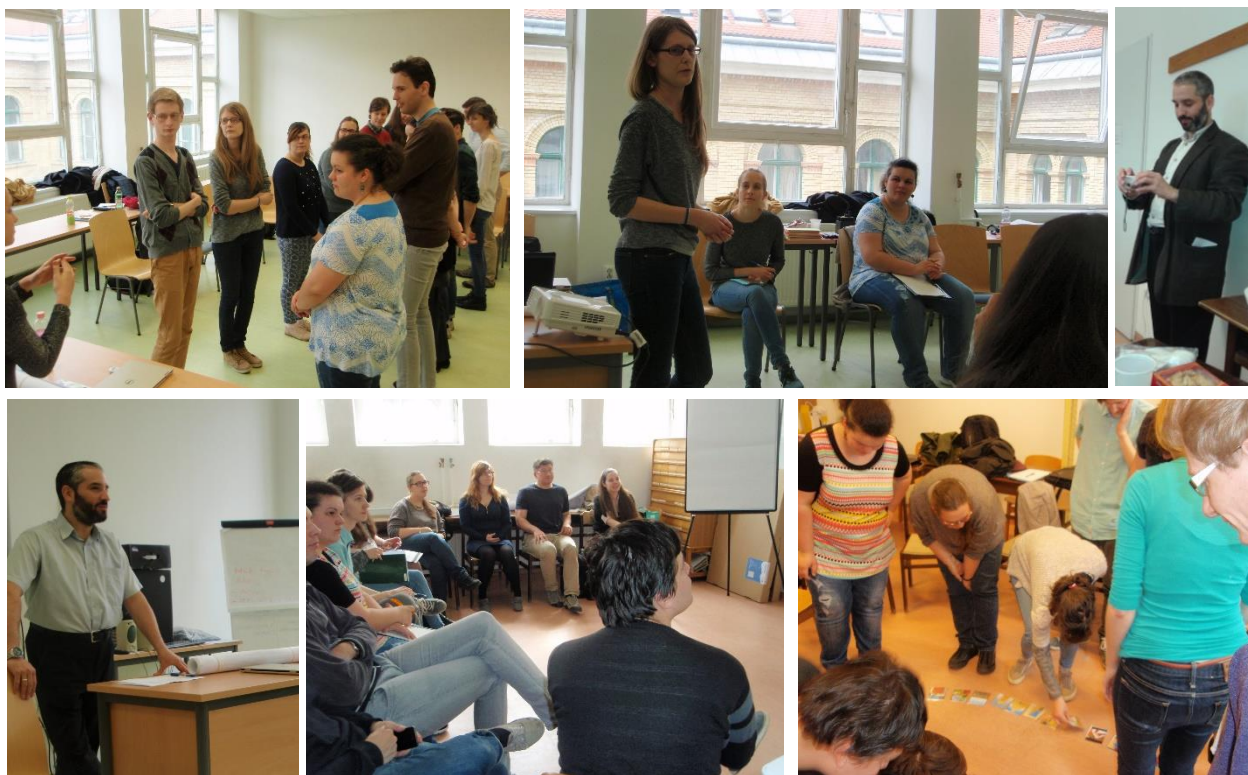
1. ábra: Pillanatképek a tréning első két napjáról.