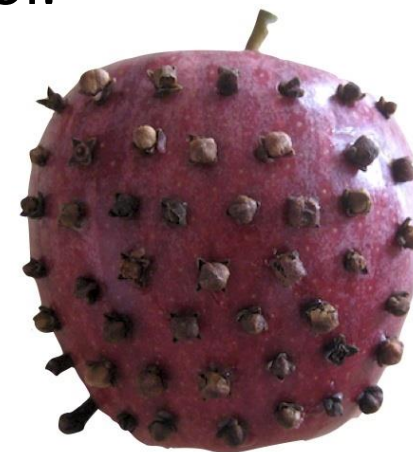
szegefűszeg almába szúrva